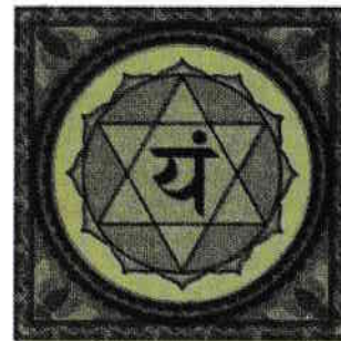
Chakra inimii, Anahata.

Înțelegând aceasta, înțelegem totodată de ce totul este iubire în Creația Dumnezeiască.